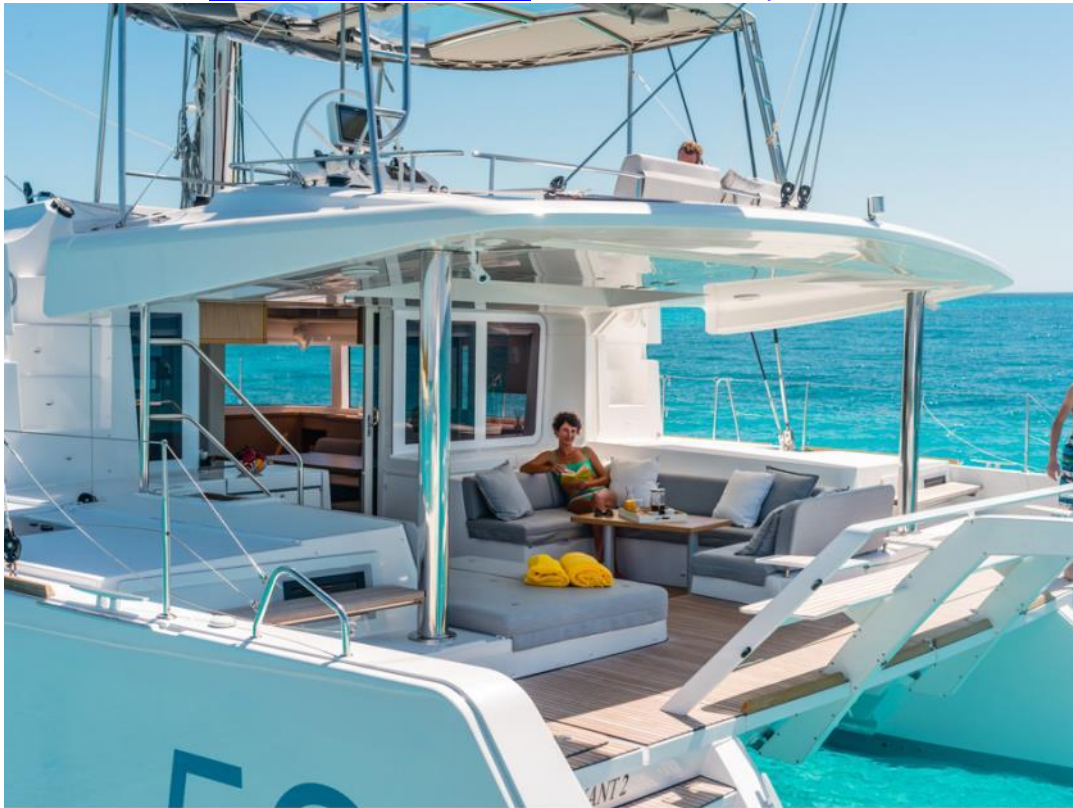
Lagoon 52 - Février 2013 - Mention obligatoire/Mandatory credit: Photo Nicolas Cianci

www.tahityachtcharter.com www.facebook.com/tahityachtcharter