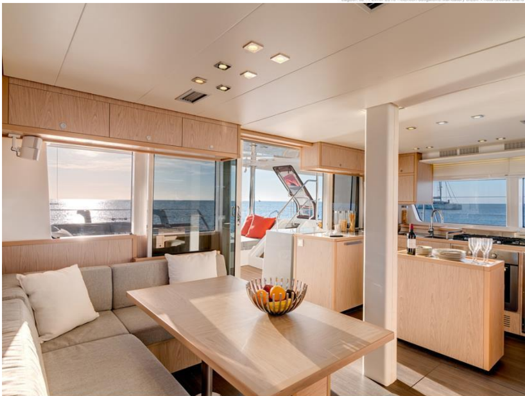
Lagoon 52 - Février 2013

S.A.R.L au capital de 25 000 000 FCP- N° Tahiti 197 764 Siège Social : Marina Apooiti- Raiatea- Polynésie française N° RC 3742 B