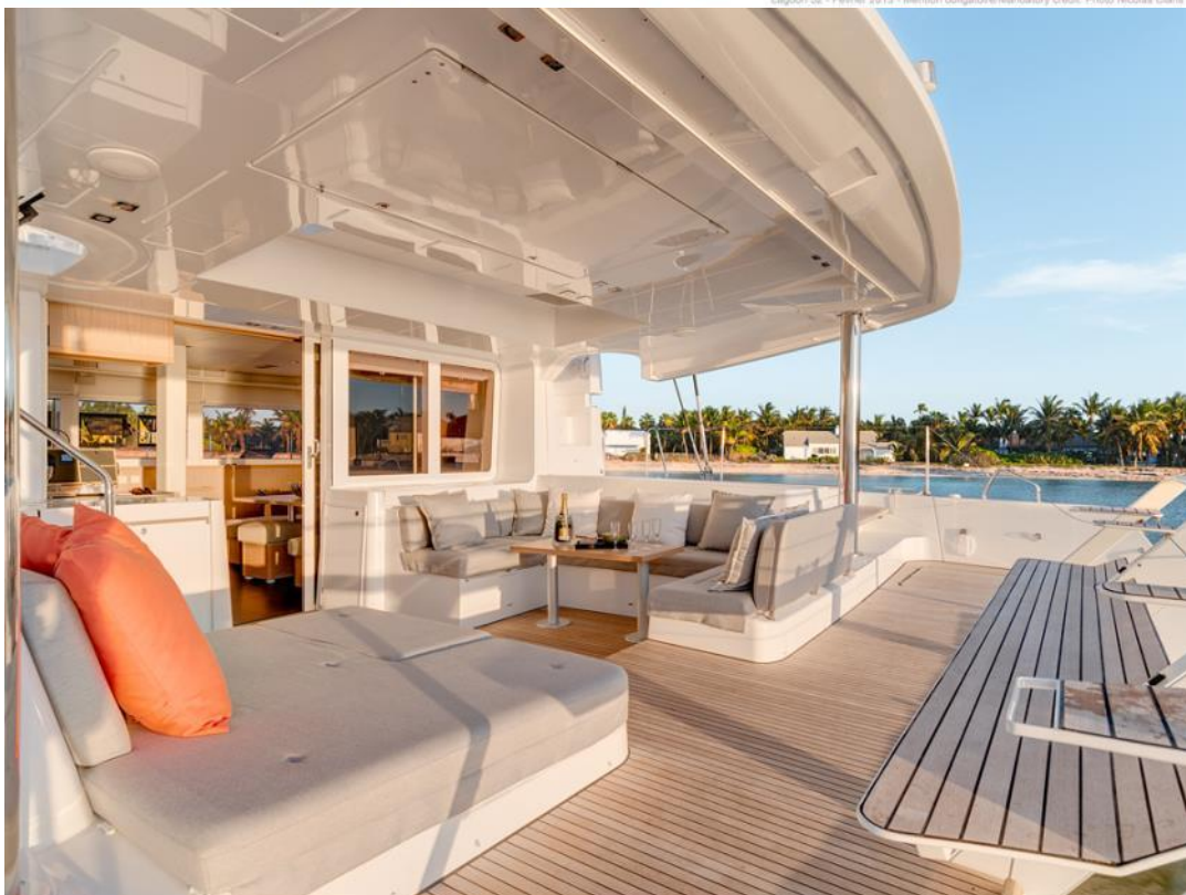
Lagoon 52 - Février 2013 - Mention obligatoire/Mandatory credit: Photo Nicolas Cianci

S.A.R.L au capital de 25 000 000 FCP- N° Tahiti 197 764 Siège Social : Marina Apooiti- Raiatea- Polynésie française N° RC 3742 B