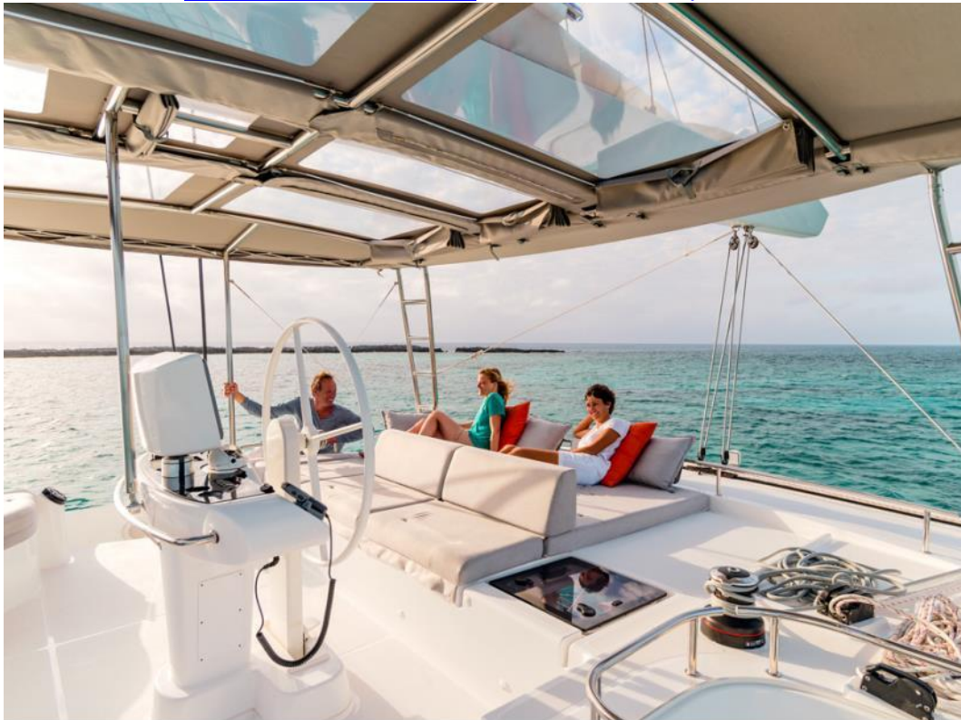
Lagoon 52 - Février 2013 - Mention obligatoire/Mandatory credit: Photo Nicolas Claris

www.tahitiyachtcharter.com www.facebook.com/tahitiyachtcharter