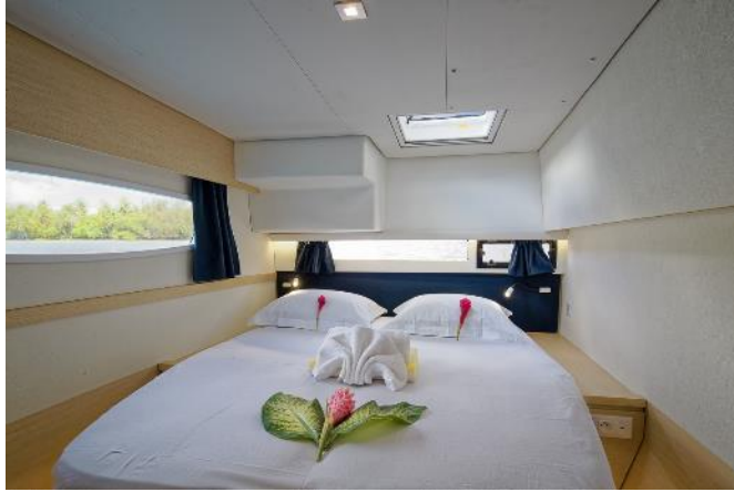
Cabine double | Double cabin