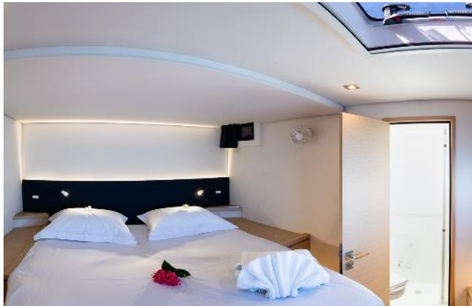
Cabine double | Double cabin