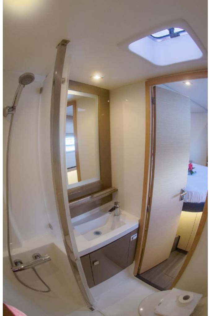
Toilette douche | Toilet shower